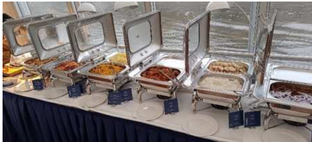
Parta HIC č. 1 ☺