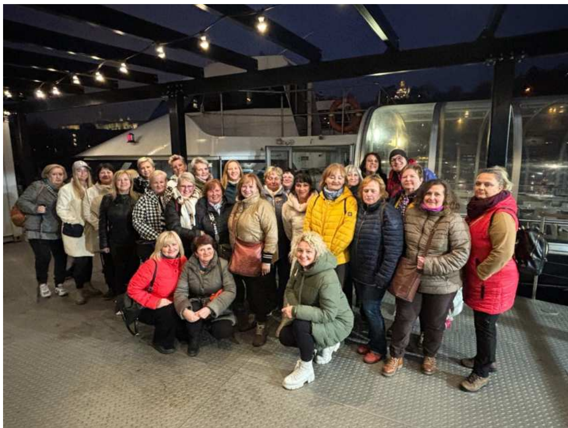
Parta HIC č. 2 ☺