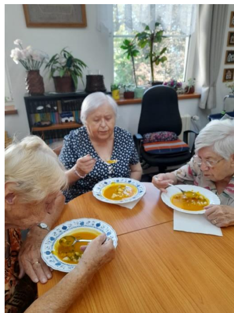
A pro velký úspěch vaření bramboračky